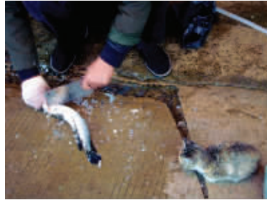
人家的喵喵有猫粮,我家主人不买,只能等着杀好鱼,搞点边角解解馋! 5月2日摄于下关