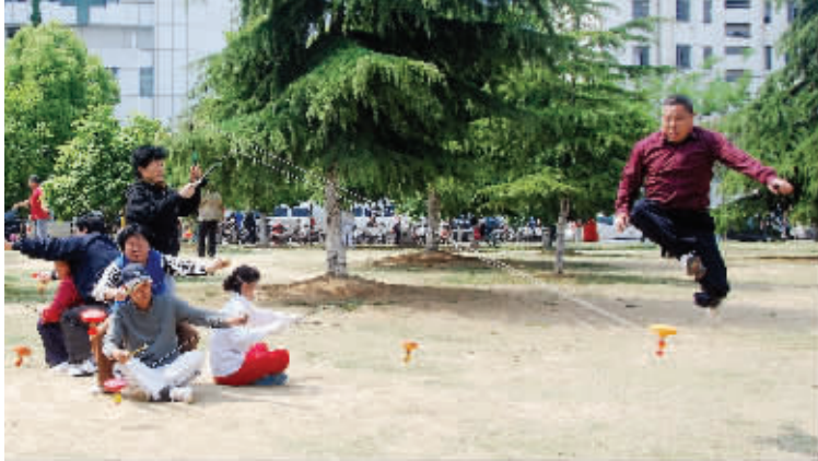
左三圈,右三圈,我抖一圈,你蹦一下,蹦蹦跳跳我们大家真开心。草地上,一群大爷大妈在抖噙,大爷却围着圈子在噙绳上跳跃,真是别出心裁。5月2日摄于玄武门