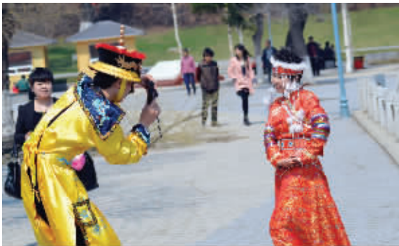
“皇上”给“香妃”照相,这场面可不多见。5月4日摄