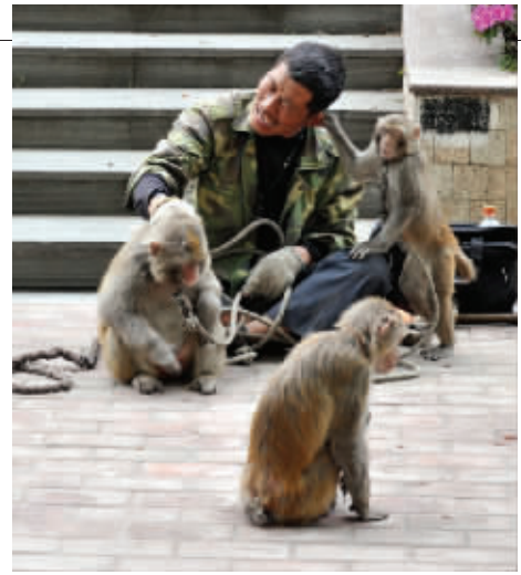
猴子揪住了主人的耳朵,主人疼得直叫唤,到底是谁耍谁?当然,和下面那位主人比起来,您还算是幸运的! 摄于中央门 (作者剑先生)