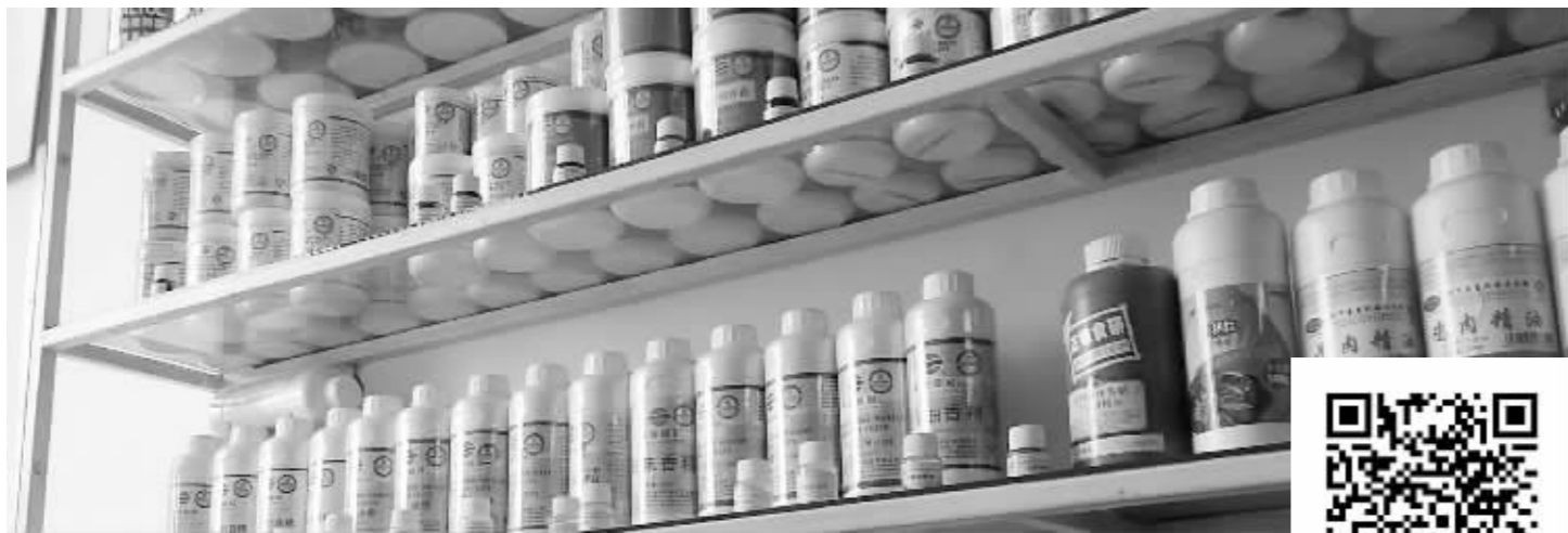
5日,现代快报记者探访南京食品添加剂市场,货架上的添加剂多种多样

现代快报记者探访南京添加剂市场,闻了十几种,鼻子“失灵”了不少副食品店夹带销售添加剂,罂粟竟成了添加剂的卖点