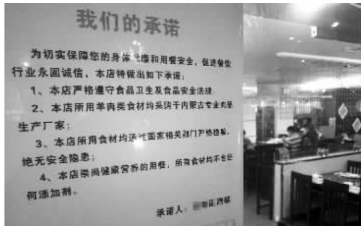
新街口一家火锅店贴出了承诺书

“做这行的,没有不知道这个(混合羊肉)的。”这位商贩说,早些年,这种肉卖得多,大家也不怎么遮掩。他们大多卖给一些小餐馆和火锅店,对于肉品的成分,双方都是心知肚明的,“什么档次的肉,我们就按什么价格来卖,但具体他们最后按什么肉卖给消费者,这个我们不好说。”而另一位商贩则说,自己以前确实卖过这种肉。“你现在想找到这种肉就更不容易了,最近风声紧,大家几乎都不敢卖了。”