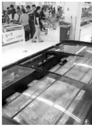
新街口某超市羊肉卷柜台无人问津