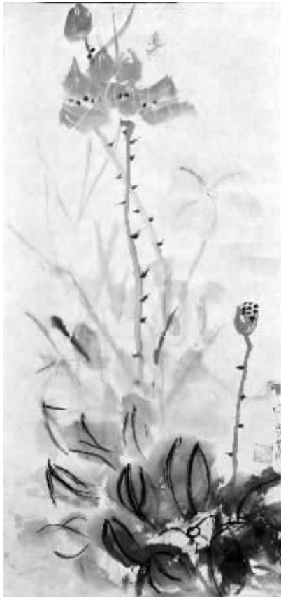
《清香四溢》 《夏》 刘倩倩 14岁 南京市二十七初级中学 (以上为目前征集到的部分作品)