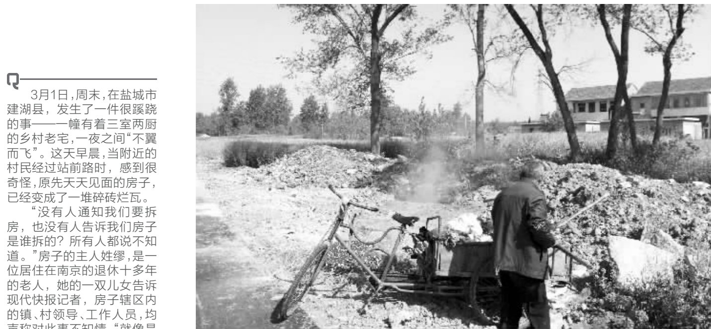
一夜之间,缪家的房子成了一片废墟,有人在此焚烧垃圾