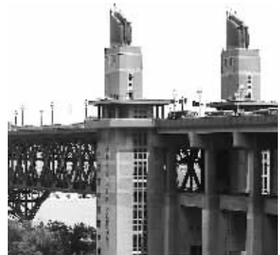
南京长江大桥当年承载着中国人的梦想

为什么会落榜呢?“这些文物点没有通过,有的是因为专家认为价值不够,有的则是争议比较大。比如南京长江大桥,不少文物专家认为这座中国人自力更生建成的第一座长江大桥,完全够格成为全国重点文保单位,但还是有不少专家有争议,最终没有通过,多少有点遗憾。”丁波说,市民也不必气馁,说不定到第八批全国重点文物保护单位公布时,就会出现南京长江大桥的名字。