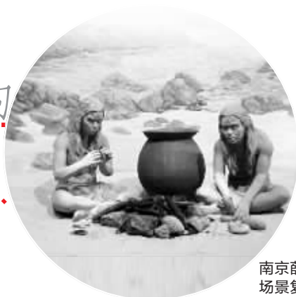
南京薛城遗址 场景复原图