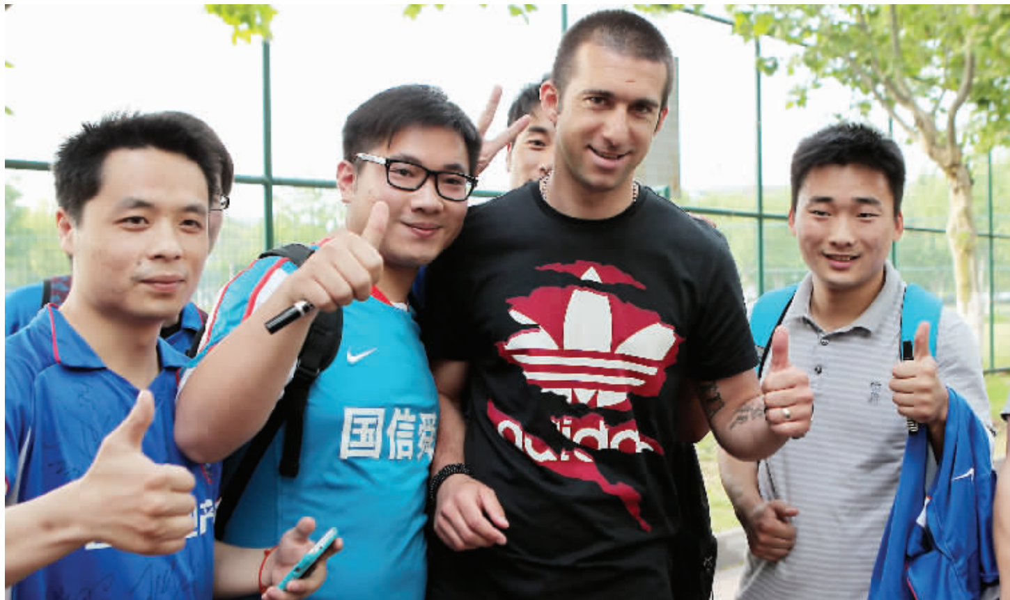
舜天球迷争先恐后地跟达10合影

时隔半年,舜天球迷异常牵挂的达10终于回来了! 昨天中午,舜天外援达纳拉赫带着妻子和孩子飞抵南京。下午,这位上赛季中超最佳射手回到球队,和队友、教练见面,相互拥抱,场面动人。在接受记者采访时,达纳拉赫带着自信的笑容说道:“我希望能帮助舜天再次冲进亚冠联赛!”