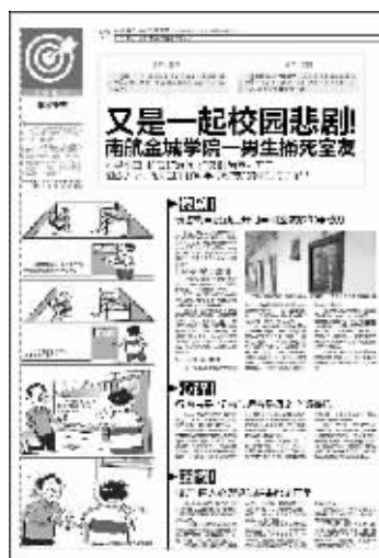
本报4月18日相关报道

快报讯(记者 刘旌 通讯员 宁琴)南京航空航天大学金城学院命案有了新进展。现代快报记者昨日从江宁区检察院获悉,目前,刺死同学的大学男生小袁因涉嫌故意伤害罪,被检方批捕。