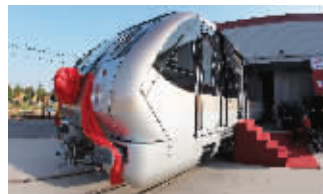
地铁十号线列车

地铁十号线列车与现有的一号线、二号线采用同型号列车。十号线列车是由浦镇公司生产制造,经过调试后,验收合格出厂。今晚,十号线首列车在浦镇公司老厂区进行分割装载,用大卡车运送,经过长江三桥、绕城高速,明天早晨运抵马群车辆基地,预计8点左右开始吊装,进行组装调试。