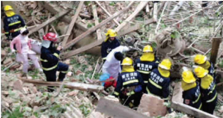
救援人员在事故现场展开营救

很快,五六辆消防车赶到现场,民警也赶到了,并拉起了警戒线。有1名民工头部受伤,被迅速送往医院,但还有3名民工被埋在了废墟下面。“是消防队员把埋在下面的3个人扒出来的,有一个人神志还清楚,但左腿动不了。还有一个人也是腿部受伤。另外一个民工受伤最重,被扒出来时就不行了。”