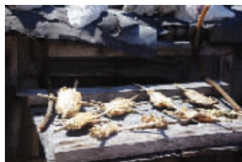
鸭公岛渔民晒的海参