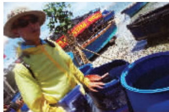
鸭公岛渔民收集的淡水