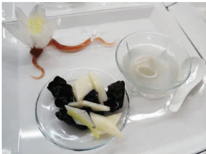
奥朗德先生大爱的萝卜汤圆低调地沉在了碗中