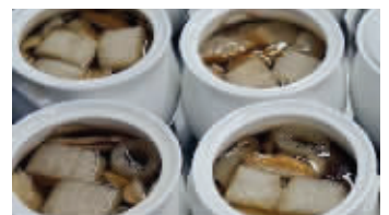
松茸野菌汤滋补养生