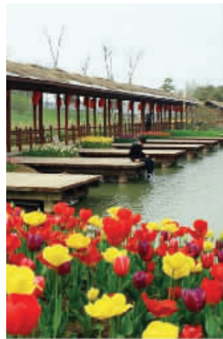
农博园一景

据农博园孙经理介绍,五一期间农博园免费开放,并将推出系列五彩缤纷的活动让市民度过一个快乐的假期。农博园内有50亩草莓地,新鲜草莓绿色无公害,就等着市民前来采摘。如果感觉采摘草莓累了,农博园内还有美丽的园内湖泊,可让人静享湖边垂钓之乐。同时,园内各色鲜花也