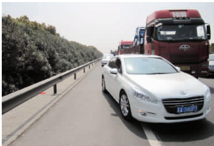
这是清明小长假期间,交巡警抓拍系统抓拍到的高速违章