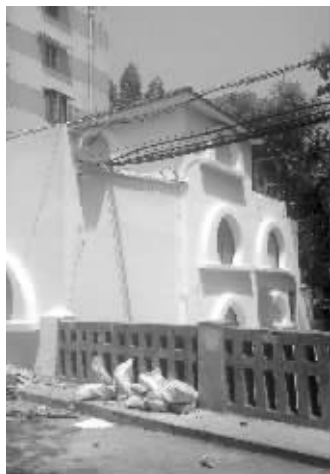
新建的小楼性质有待调查

“闹市区怎么会有这么突兀的建筑，都侵占了内秦淮河堤。”近日，有市民反映，在成贤街文昌桥桥头有一幢正在装修的楼房，听