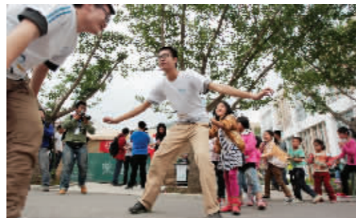
大学生志愿者带着灾区小朋友玩游戏