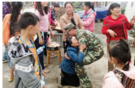
一位老太太给救援战士送来鸡蛋,激动得下跪