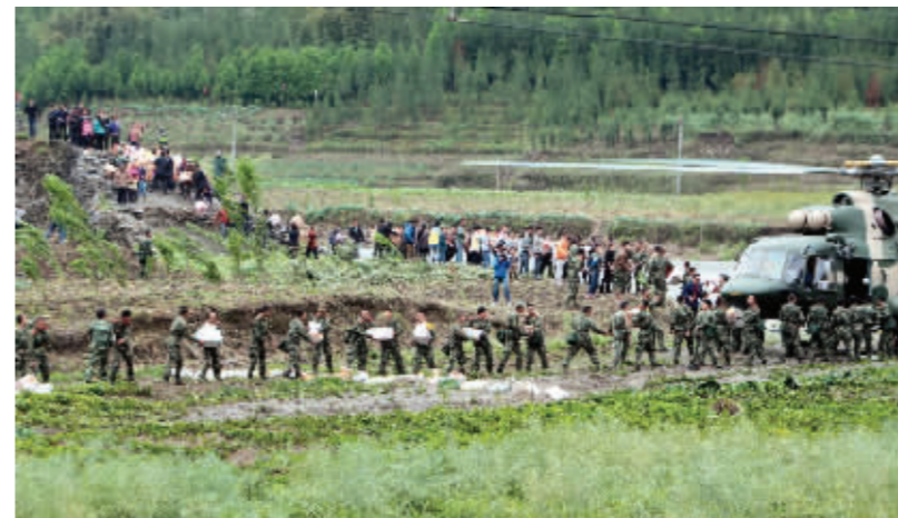
直升机给灾区民众运来物资

祝福每一个灾区人民。 你们从未被忽视, 我们向来坚强, 中国今非昔比。 因为我, 雅安繁华散尽, 因为灾难,