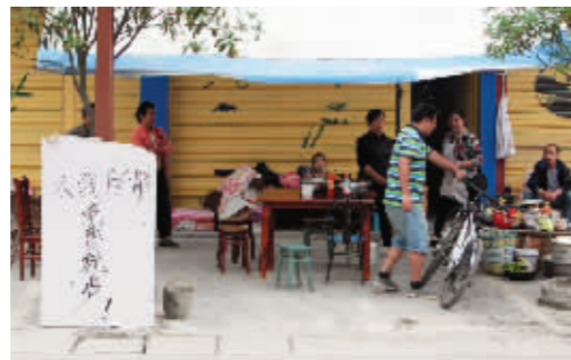
灾区百姓拿出余粮设立免费就餐点