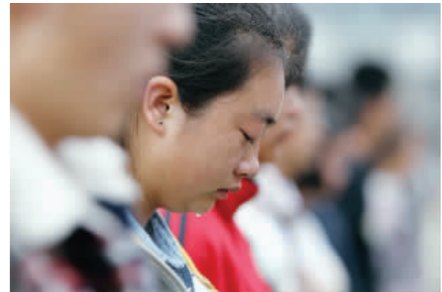
哀悼日,向死难同胞默哀

祝福每一个灾区人民。 你们从未被忽视, 我们向来坚强, 中国今非昔比。 因为我, 雅安繁华散尽, 因为灾难,