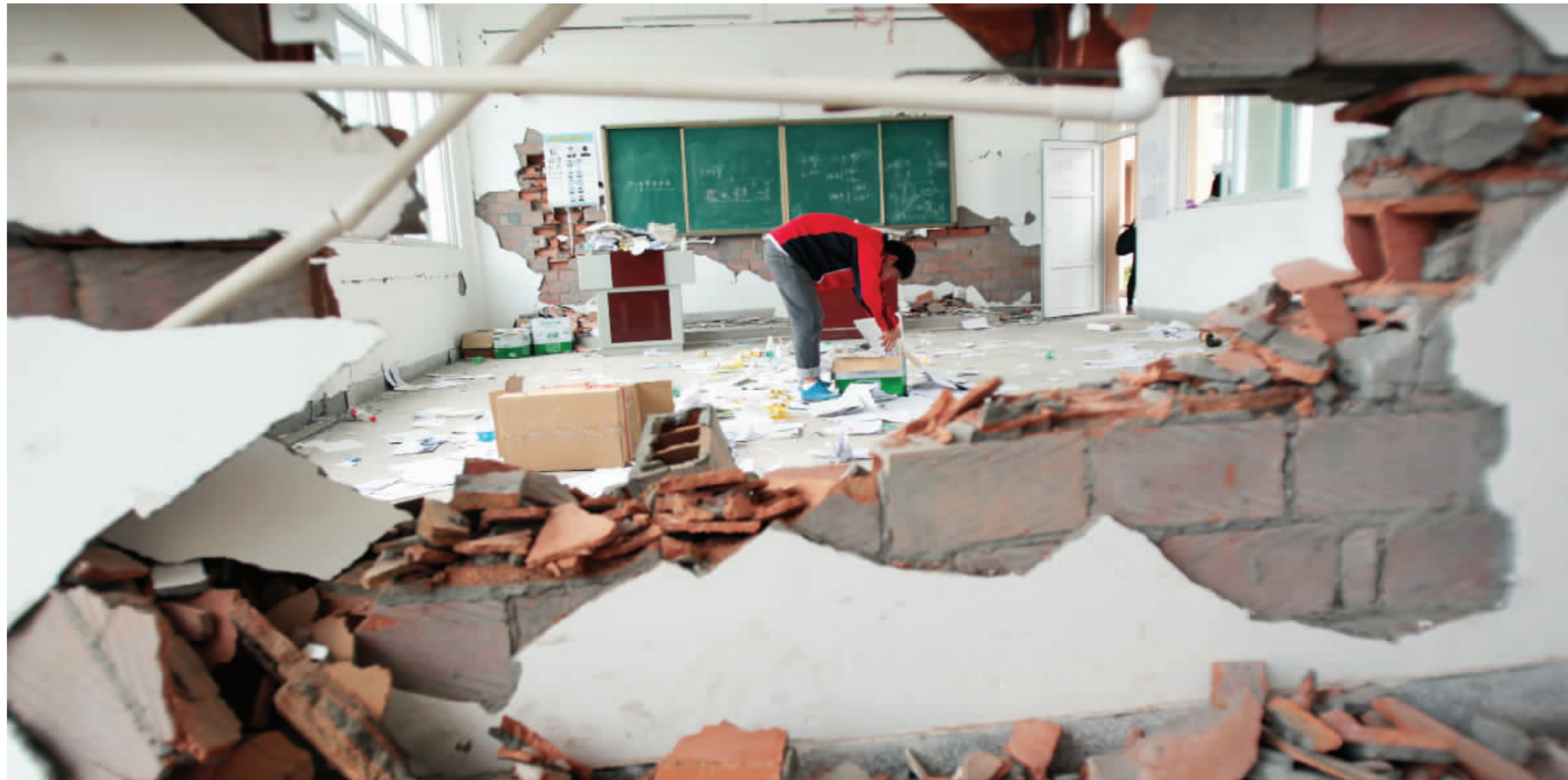
重拾课本,重拾希望。芦山中学高三学生准备启程去成都备战高考,他们的教室已被震成一片废墟