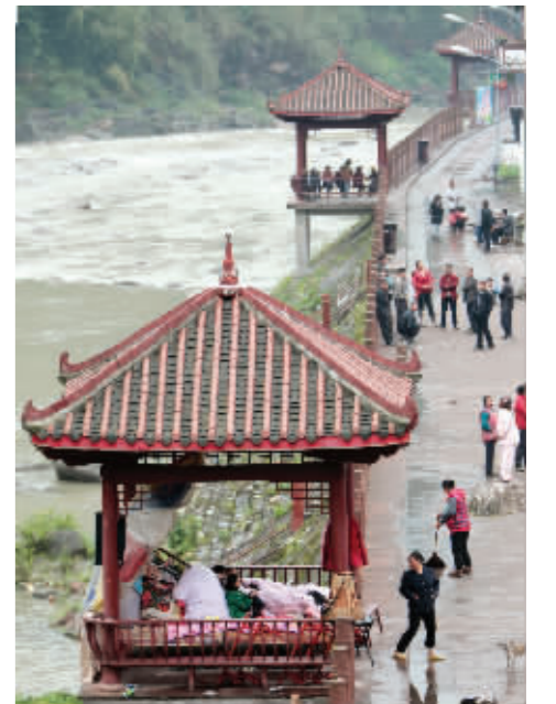
震后第三天,芦山的受灾群众临时居住在河边凉亭内