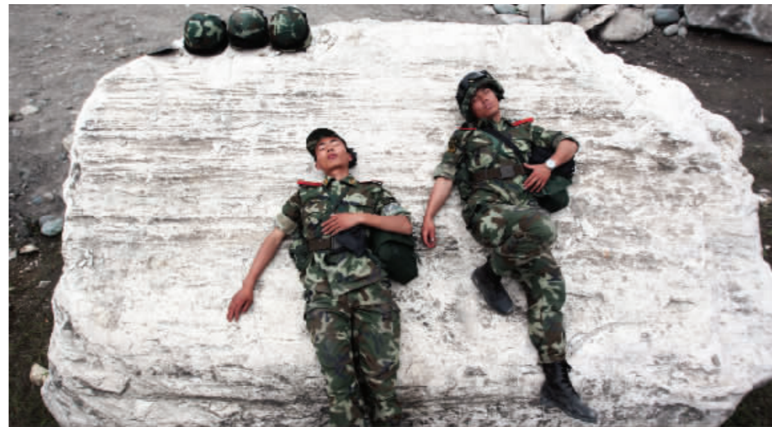
第一批进入灵关镇的战士,在连续救援十几个小时后,累倒在大石上睡着