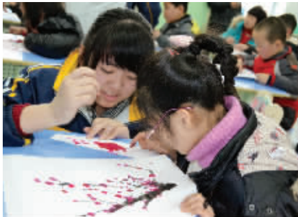
孩子们的校园学习生活丰富多彩