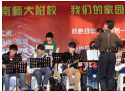
孩子们的课余生活充满欢乐