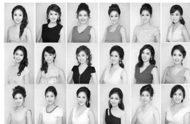
2013年度韩国小姐候选佳丽照片