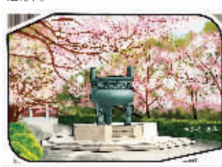
南林樱花大道明信片

曾军介绍,异形明信片从今天开始正式发行,最先印刷好的南林明信片共计1200套,四张一套,“明信片主要是想给毕业生们留一些纪念,所以同学们如果携带学生证,说不定可以享受优惠价。”