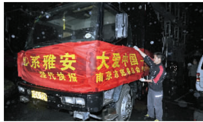
装满500顶爱心帐篷的卡车昨晚启程赴灾区