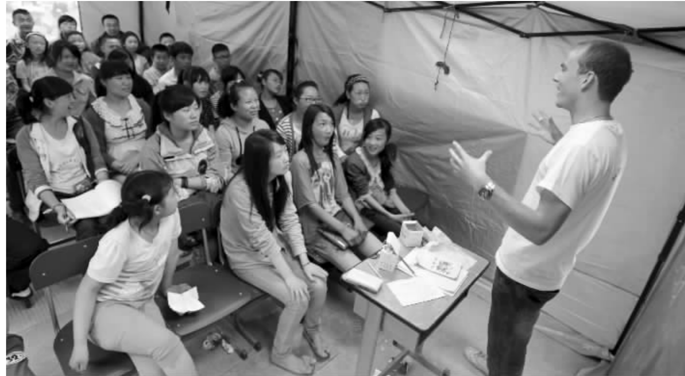
“帐篷学校”正在上课