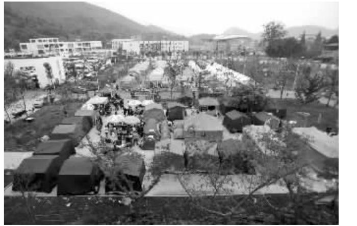
灾区的帐篷还是缺