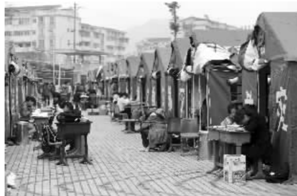
四川省天全中学高三学生在备战高考