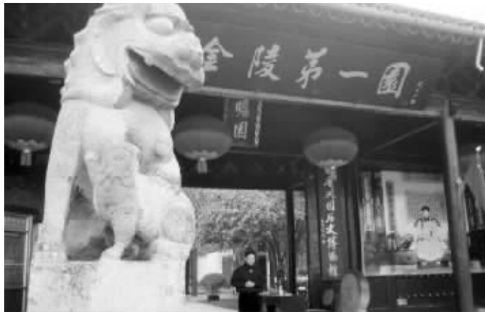
南京太平天国历史博物馆位于瞻园内 本版均为资料图片