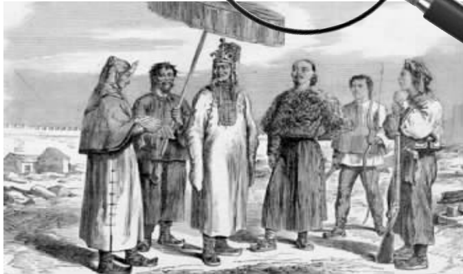
洪秀全与随从在南京铜版画