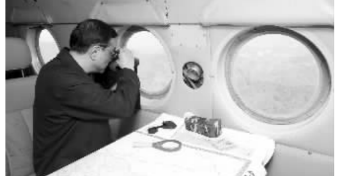
李克强在直升机上用望远镜察看受灾地区

20日下午，中共中央政治局常委、国务院总理李克强赶赴四川芦山“4·20”地震震中灾区。他来到医院，攀上废墟，走进帐篷，代表党中央、国务院向遇难同胞表示深切哀悼。向受伤和受灾群众表示诚挚慰问，并现场指导救灾行动。震中芦山县很多道路被毁，不少地方通信中断。李克强乘飞机在四川邛崃机场降落后，得知通往灾区的公路不太通畅。为节省时间，李克强马上决定乘运输救灾物资的直升机直飞震中灾区。他说，现在一切为了救援，要尽快赶到一线。