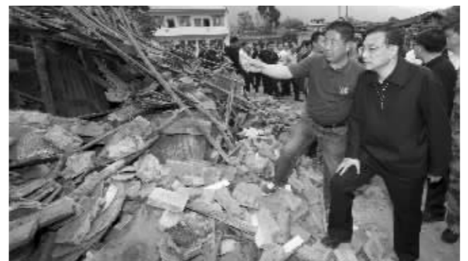
李克强在受灾严重的双石镇察看灾情