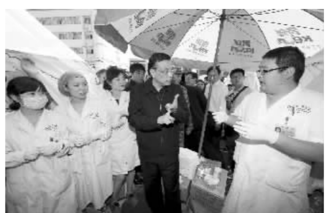
李克强向医护人员询问受伤群众救治情况