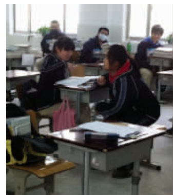
为防过敏,学生戴起口罩

昨天下午,鼓楼区教育局决定,两个年级共计500多名学生,全部搬回正准备装修的1号楼,施工队退场。“下一步,我们会加强教室通风,增加绿植,让气味散尽。”这名工作人员称。