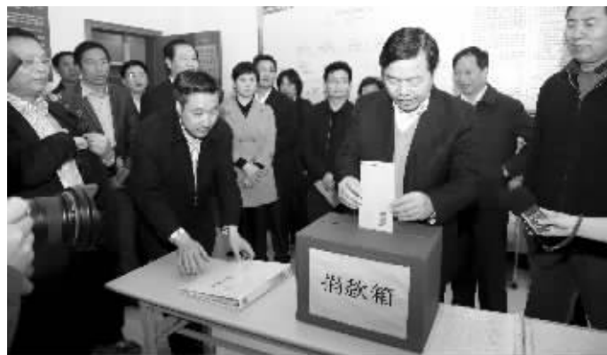
南通市委书记丁大卫昨日向汉生爱心互助协会捐款