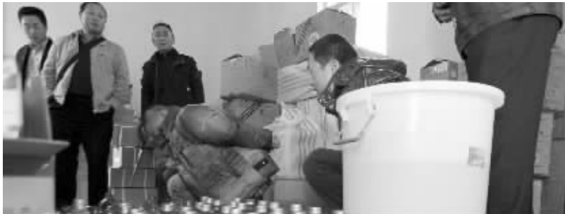
警方抓获的假酒制售人