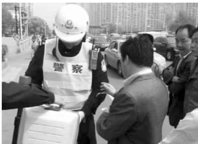
交警在通济门隧道出入口处罚违规驾驶员