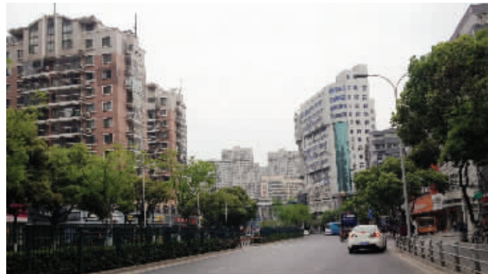
北大街改名中山路引起市民热议

史地名承载了老百姓深厚的情感,拟在莲蓉桥堍竖一块碑,介绍北大街的历史。充分挖掘北大街、北塘大街、接官亭弄和天主教堂的悠久历史和里弄文化。此外,我们考虑在沿街店面、写字楼、住宅楼等标注标准的中山路门牌号的同时,在门口放一个小牌子,上面标注‘原北大街××号’。我们将多吸纳群众和专家的意见,做好北大街地名的保护工作,使北大街历史元素得到更好的延续。”