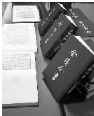
《金陵全书》书样