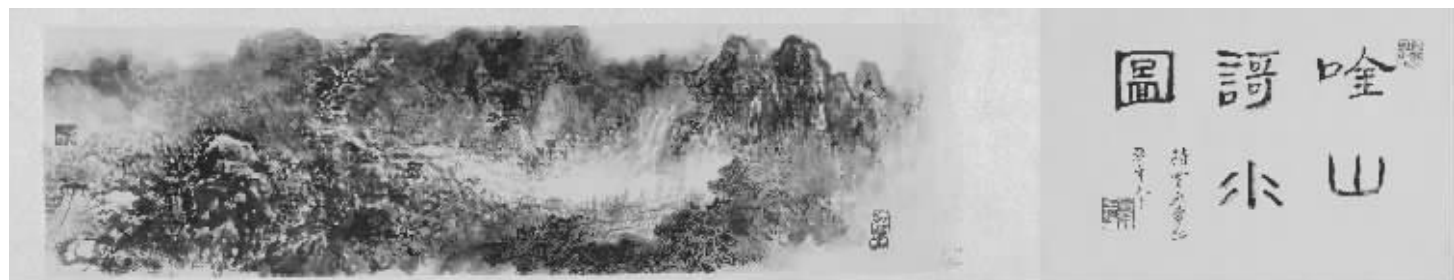
钱持云《吟山歌水图》(沙曼翁题引首)

注:1、请参赛者务必在“作品组别”一栏填写所属的年龄组别,否则作品无效。2、请将该表贴于作品反面送交大赛组委会。