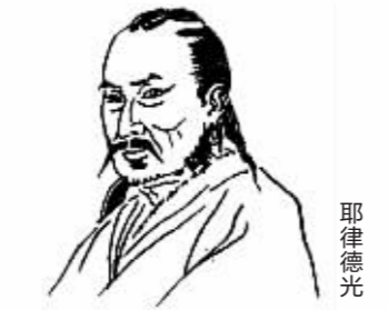
耶律德光 契丹神册四年(公元919年)葺辽阳故城建东平郡。天显三年(公元928年)迁东丹国都于此,升为南京。 《辞海》

契丹神册四年(公元919年)葺辽阳故城建东平郡。天显三年(公元928年)迁东丹国都于此,升为南京。 《辞海》