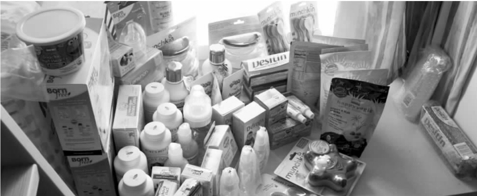
王女士海淘来的商品的一部分,包括爽身粉、驱蚊水、奶瓶、液体钙镁锌等等

不少海淘达人也纷纷发出号召,“海淘有风险,购物须谨慎!”他们表示,如果货物内有易碎物品等,一定要让转运公司加固一下;此外,转运商品的时候,最好根据商品特性进行保价,以免“因小失大”;此外,他们还提醒,使用信用卡在国外网站购物时,一般只需要卡号、有效期、安全码和姓名拼音,不需要输入密码,因此建议“海淘客”们在购物前,设置手机的短信提示,以防盗刷。