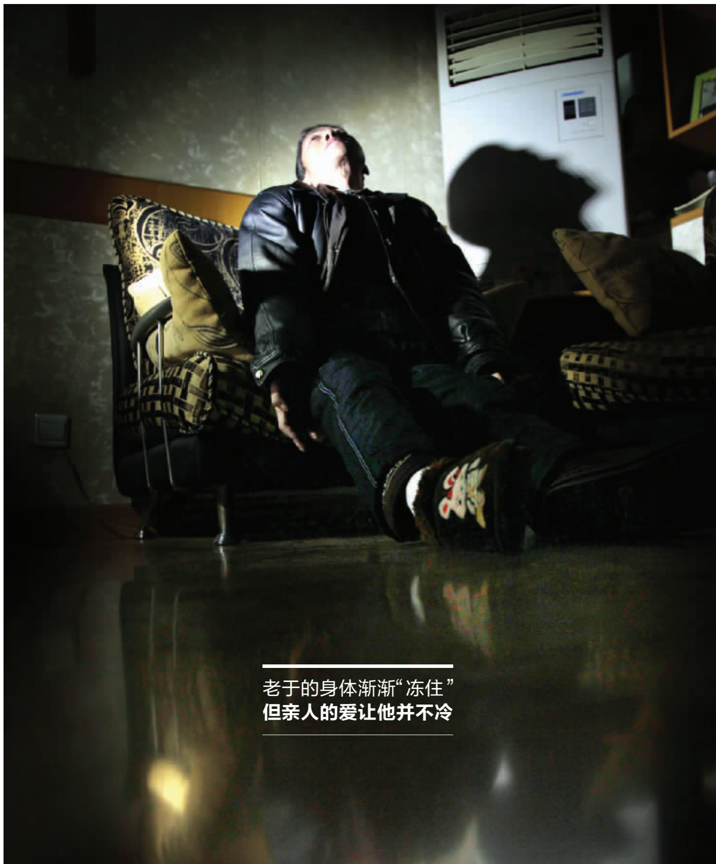
老于的身体渐渐“冻住”但亲人的爱让他并不冷