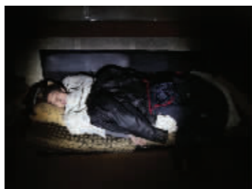
由于行动不便,他经常在沙发上,一躺就是一天