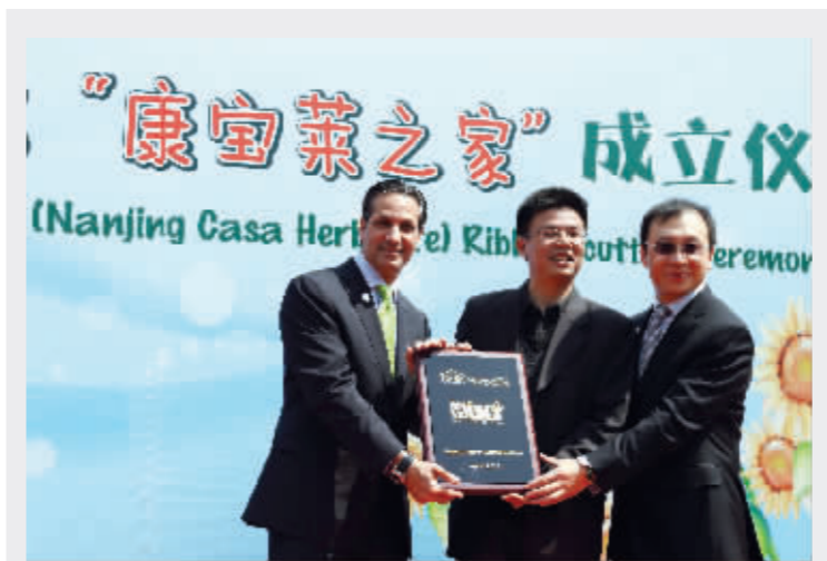
本次落户南京的“康宝莱之家”是目前内地第三家“康宝莱之家”。前两家分别在2009年和2011年成立于成都和北京