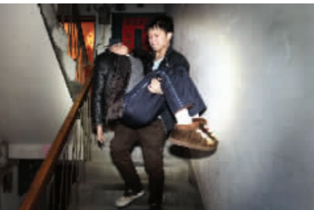
小子下班后,看天气好的时候,偶尔也会抱着爸爸下楼晒晒太阳