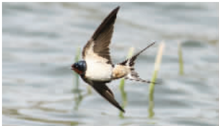
夏候鸟的先头部队以燕子为主 资料图片