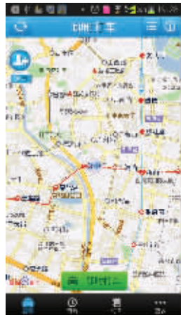
“易打车”软件使用界面

据悉,易打车软件与司机合作方式分为两种,包括司机个人或者出租车公司与电信签订合同;城市里所有司机均可在appstore以及安卓各大应用市场及官网上下下载易打车软件,上传相关证件由电信后台开通后即可使用。