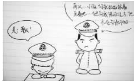
7.真相：所以，你就从了老秦吧！