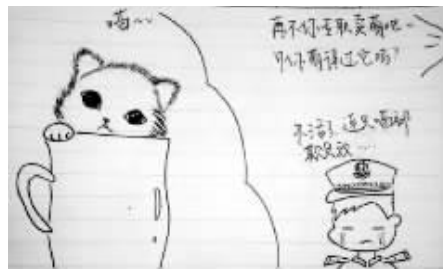
6.接着训：卖萌卖不过小喵。