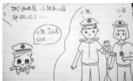
5.接着训：微电影做不过常熟公安和平安园区。