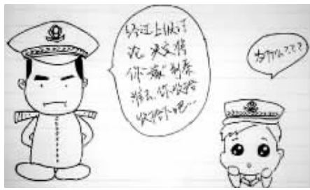
2.领导决定将小白“嫁”给老秦，小白表示不解。