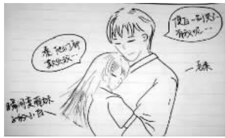
8.旁白：“在一起，在一起……”