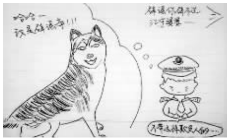
4.接着训：辟谣辟不过江宁公安在线。