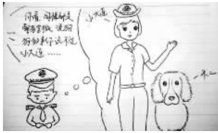
3.领导训小白：你说狗狗的事说不过小大连。