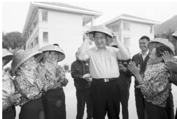
9日,习近平高兴地戴上黎族群众递上的斗笠。