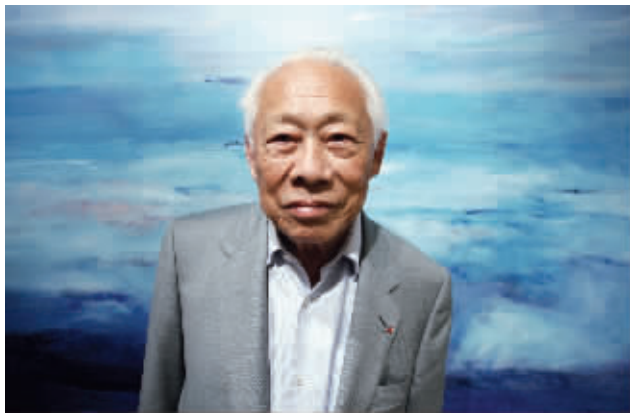
赵无极被誉为海外华人“艺术三宝”之一

赵无极1921年生于北京, 1948年赴法国留学并定居法国。他将西方现代绘画形式和油画的色彩技巧, 与中国传统文化意蕴相结合, 创造了色彩变幻、笔触有力、富有韵律感和光感的新的绘画空间, 被称为“西方现代抒情抽象派的代表”。