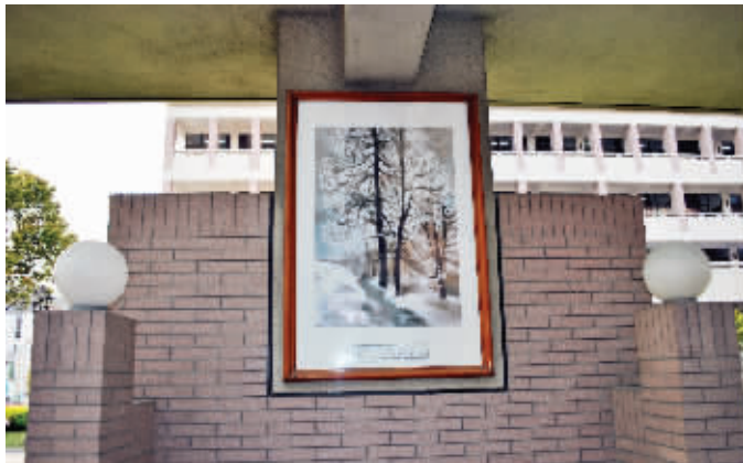
母校南通中学长廊里还挂着赵无极的画作