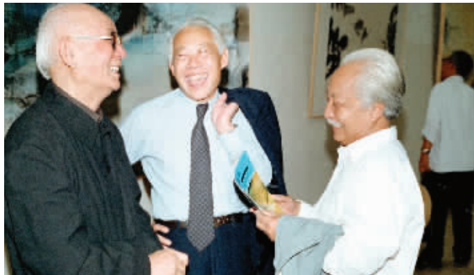
1983年, 赵无极的36幅油画和水墨画在北京中国美术馆展出。这是赵无极(中)在展厅和著名国画画家李可染(左)、张汀交谈