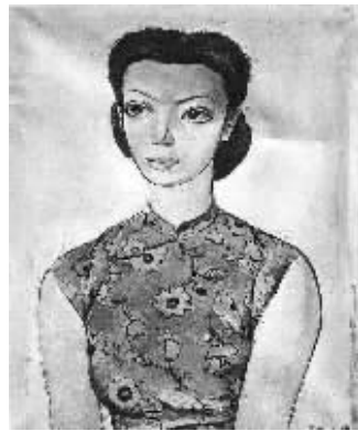
赵无极作品《年轻女子》