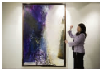
赵无极作品《25.06.86桃花源》