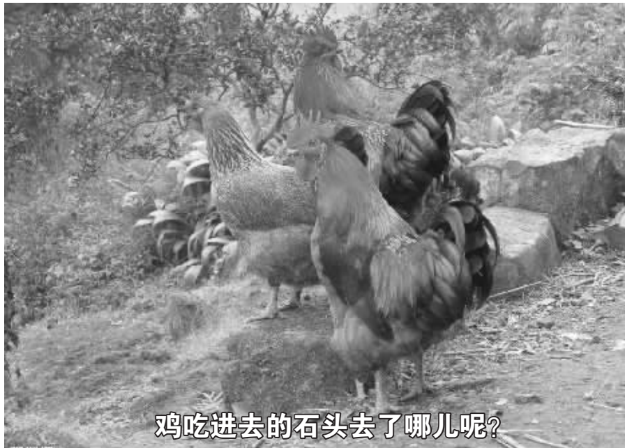
鸡吃进去的石头去了哪儿呢?

张教授利用现代科普仪器进一步分析发现:人体内的结石成分基本相同,均为草酸钙,这种成分本身并不难被溶解,为什么很多药物无效呢?主要是因为结石的表层包裹着一层高密度的矿物质,极难被溶解。因此要想化掉结石必须先化掉结石的“壳”。而鸡内金中含有一种特殊的成分“多酚生物碱”,它就像是治疗结石的排头兵,矿物质一遇见它就发生“碱化反应”而崩解。据此发现,张教授以鸡内金为主料,再加