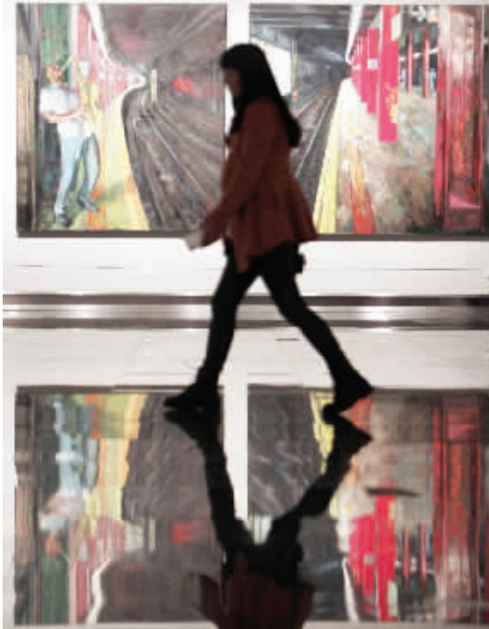
“四十年的故事”画展终于来到南京

“50后”艺术家林旭东、陈丹青、韩辛正在江苏省美术馆用展览讲述“四十年的故事”。昨日,三位艺术家亲临展览开幕式现场,为观众讲述了一个有关艺术、岁月和兄弟情谊的故事。三位艺术家还举办了讲座,他们用幽默轻松的语言让观众感到艺术原来这么贴近生活。