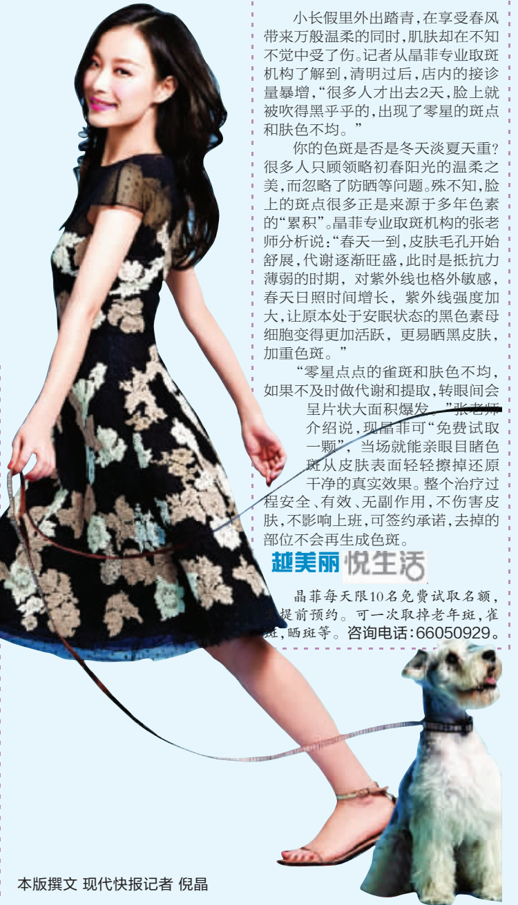
本版撰文 现代快报记者 倪晶

据了解,299元的丰胸疗程包括4次店内丰胸技法课程,和一套10天用量的居家丰胸产品,该疗程下来可增大2至5厘米。孟经理表示,春季享用纯中医的经络丰胸技术,还能改善色斑、失眠、水肿等亚健康状况,从根本上告别经络阻塞,也保证了丰胸的效果更健康更稳定。