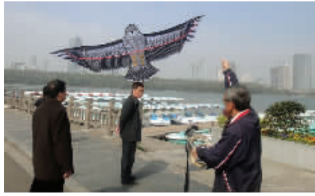
老师傅,麻烦把你家老鹰带远点。您不知道现在闹禽流感吗? 4月3日摄于玄武湖