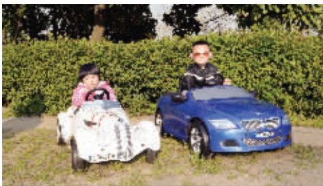
趁着天气好,自驾游去。4月7日摄于管子山