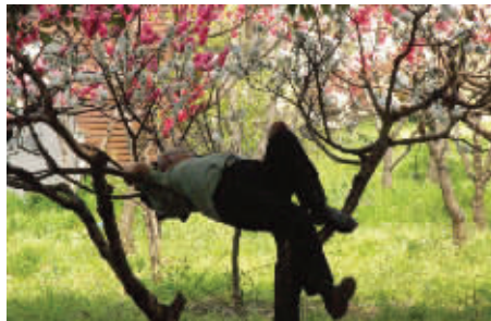
大哥,您能下来吗?躺这睡觉,也不怕花妖收了您! 4月4日摄于白马公园