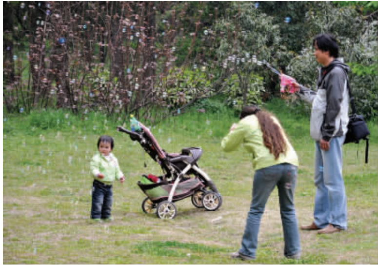
为了照片的效果,爸爸担当起道具师,满天吹泡泡,妈妈则抓住瞬间,拍下宝宝的照片。4月4日摄于南京植物园