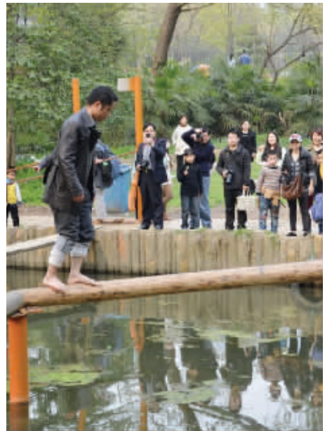
虽然大家可能都在叫“没事的,往前走”,但是我觉得其实他们都想听“啊”——“噗通”,瞧,远处还有等着抓拍的。3月30日摄于植物园