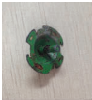
手术取出的陀螺