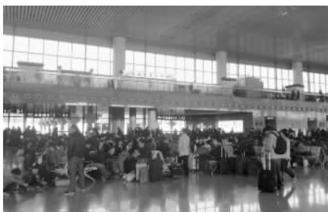
南京南站候车大厅里坐满了人