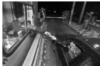
7日零点,沪宁高速南京收费站恢复收费

昨天晚上,现代快报记者来到沪宁高速和长江二桥。长江二桥的车流量相对大一些,但从夜间10点开始,小车的车流量明显减少。交警认为,这是因为免费通行已经实行多次,司机都有了经验,不会争抢最后的时间,因此交通状况相对比较好。