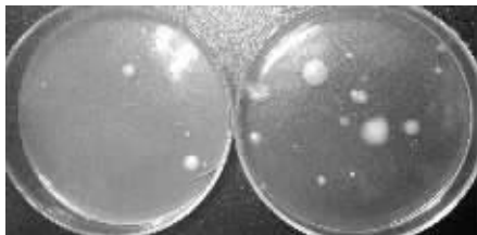
手机B上的细菌