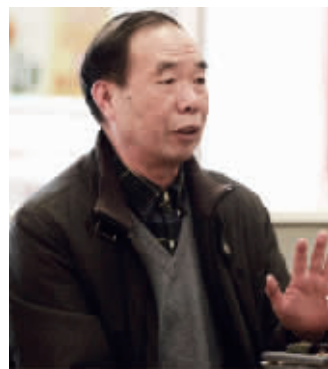
谈起李克强总理,龚维平至今印象深刻