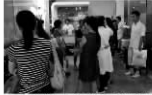
众多学生在麦迪格中心体验非手术摘掉近视眼镜

临床案例,越来越多的家长预约麦迪格为孩子治疗近视。使用麦迪格摘掉近视眼镜的孩子会越来越多。