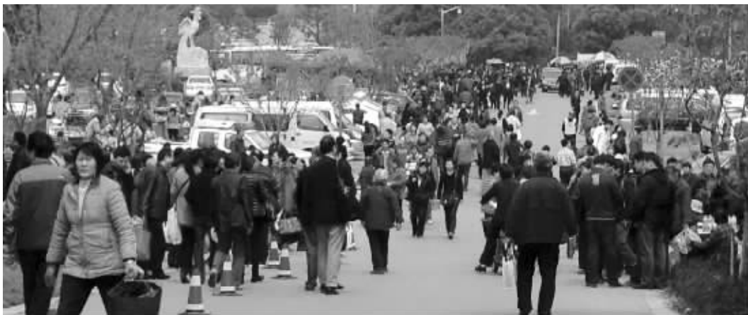
上个双休日,到苏州各个墓园祭扫的人超过40万

来自苏州绕城高速公司的统计数据 displays, 上个双休日绕城高速西山、东山、石湖、淀山湖、光福等5个靠近墓区的出入口总车流量达到了47402辆,比此前一周增加了5000辆。工作人员表示,由于此前已经预计到上个双休日会出现扫墓车流高峰,他们在相关出入口都增加了值班人员,同时加强路段巡逻,发现事故及时处理,避免造成堵车。