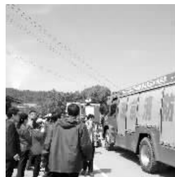
牛首山景区火灾引来了消防车

“山上都着火了,你们还能不烧啊?”张明跃试着劝说扫墓市民,但没人理会,“一个清明下来,血压都升高了,牛首山这个月都发生4起火灾了。即使山上安排了40名工作人员驻点巡逻,但是烧纸钱放鞭炮仍堵不住。”张明跃告诉现代快报记者,今年清明节,他特地在大门口放了大牌子,“向所有文明祭扫的市民敬礼”,如果还是没效果,明年清明就准备打“跪求扫墓市民别放鞭炮”的横幅了。