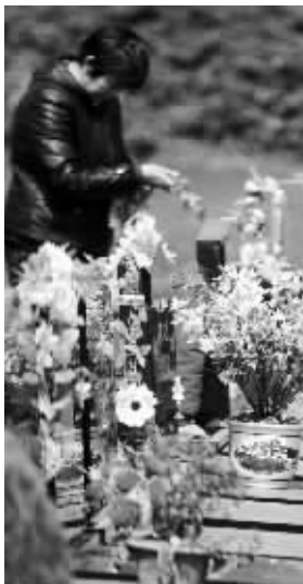
墓地价格高,并非南京独有现象