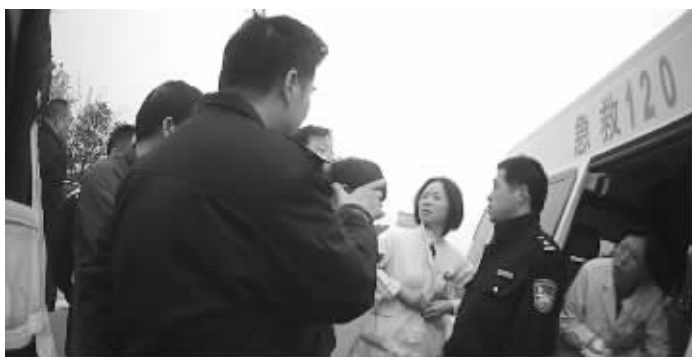
女民警(中)扮成医护人员参与营救

高速公路一大队的民警是第一个赶到事发现场的,事发车辆是苏州开往汉中的卧铺车。犯罪嫌疑人