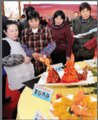
精品菜肴很有人缘