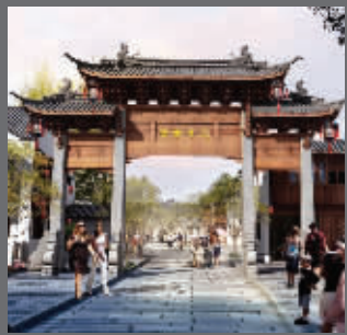
浏河古镇改建效果图