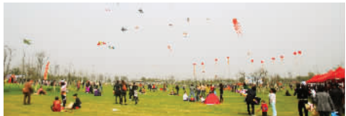
金仓湖风筝文化节非常受欢迎

好者的参与,许多家庭利用难得的假日前来观赏。趁着风和日丽,一家老小在翠绿的草坪上尽享天伦之乐。仰视金仓湖上空,近千只各式各样的风筝漫天飞舞,整个金仓湖公园汇成了一片欢乐的海洋。