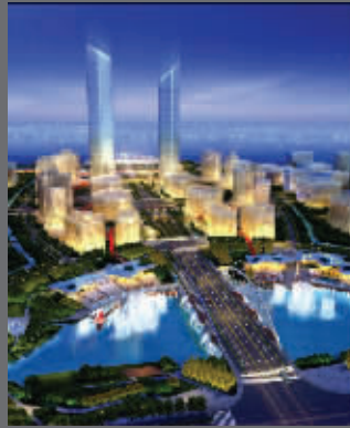
江海天地湖滨公园效果图