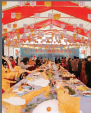
美食节荟萃精品菜肴