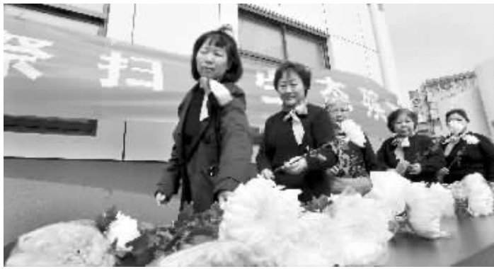
樱驼花园举行文明祭扫活动