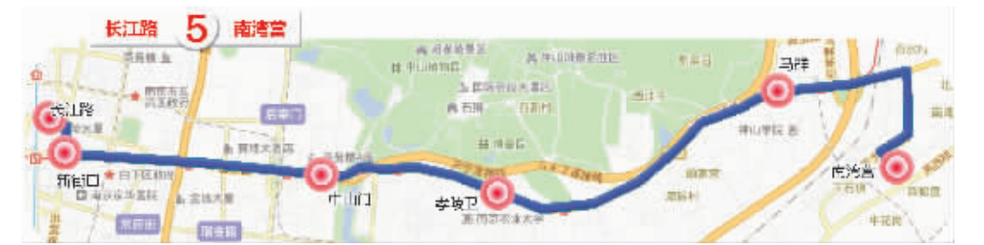
部分站点: 龙湾营、文康苑、融康苑、宁康苑、百水芋城、马群客运站、马群、钟山学院、五棵松、柳营、钟灵街、大柵门、孝陵卫、理工大、小卫街、卫岗、卫桥、中山门、明故宫、西安门、逸仙桥、大行宫、新街口东站、长江路

转发 (523) | 收藏 | 评论 (116) 这是3月13日深夜，现代快报微博发出的内容。当天，传出了南京5路公交要被撤销的消息。随后，200多名读者给现代快报热线96060打来电话，近半数来电读者，对5路表达不舍，希望这一线路能够保留下来。 快报读者的建议，得到了相关部门的回应和采纳。与征求意见稿相比，昨天公布的最终方案发生了不小的变化。具体为：目前的163路与5路重合路段较长，开通时间较短。撤销5路公交线路(莫愁新寓-柳营)后，将现163路(新街口-龙湾营)命名为5路，保留5路线继续在中山东路上运行服务。此外，805路夜间线路起讫站、服务时间不变。