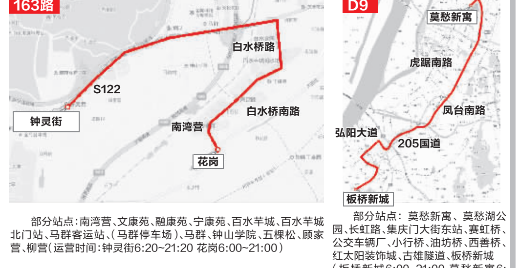
部分站点: 龙湾营、文康苑、融康苑、宁康苑、百水芋城、百水芋城北门站、马群客运站、(马群停车场)、马群、钟山学院、五棵松、顾家营、柳营(运营时间: 钟灵街6:20-21:20 花岗6:00-21:00)

新辟花岗至钟灵街的187路: 这次被重新命名为163路。由于花岗保障房公交场站、对外联通道路到今年7月份左右才能竣工使用,该线路暂时开通至龙湾营。 新辟D9线: 由板桥新城开往莫愁新寓。城西干道施工期间,临时绕行长虹路、水西门大街、莫愁湖西路,今年10月左右城西干道竣工后调整到正式路段。 141路: 东端由龙湾营延伸至花岗保障房,将花岗保障房与南京火车站连接。待花岗具备场站、道路条件后线路正式延伸。