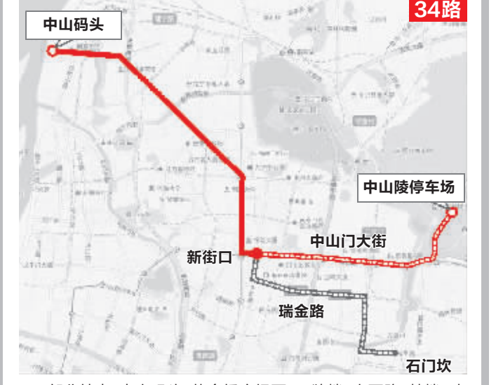
部分站点: 中山码头、盐仓桥广场西、三牌楼、山西路、鼓楼、珠江路北站、新街口东站、大行宫、明故宫、中山门、下马坊、博爱园、中山陵(中山码头4:30-22:40 中山陵5:15-19:00 中山门23:20)

34路: 改造为“中山线”,将中山码头、中山北路、中山路、中山东路、中山陵沿线民国历史遗迹串联起来。考虑到光华门、石门坎、装饰大世界附近市民出行问题,方案确定25、27、29、52路等替代线路,将增加20辆公交车。 9路: 不再进入中山陵,西段调整至汉中门大街、江东北路。 29路: 东段强化对银龙花园经逸苑小区1至4期居民的公交服务,西段由五洲装饰城缩线至莫愁新寓。